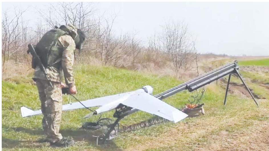
На сегодня это одно из самых безопасных направлений для прохождения службы по контракту

Служба в войсках беспилотных систем имеет ряд преимуществ: гарантированное увольнение по окончании срока контракта, работа исключительно в войсках БПЛА, обязательное обучение и высокие дополнительные выплаты за уничтожение вражеской техники – до 500 тысяч рублей.