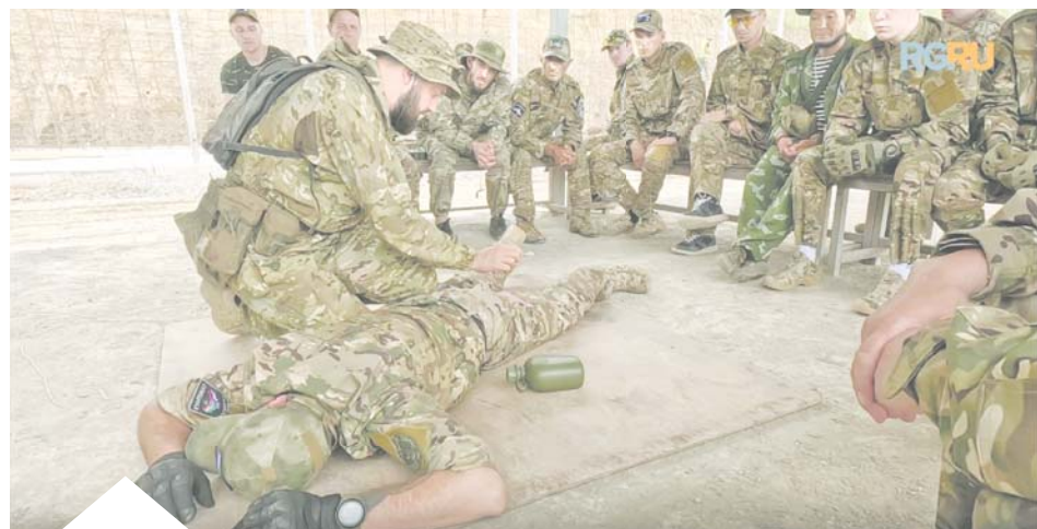
В «Ахмате» говорят, за 10 дней учат профессионально стрелять, штурмовать в городской черте, а главное – беречь жизни бойцов

– Эта командировка была для получения боевого опыта, 15 дней работали очень плотно. «Ахмат», по сути, такое же подразделение ВС РФ, но в нём очень много опытных специалистов,