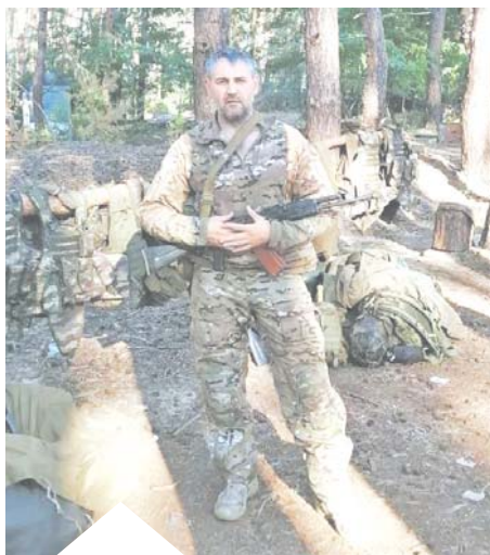
«Захотелось просто помочь нашим на передовой, тем более что ребят знакомых там достаточно».

Свою главную солдатскую медаль «За отвагу», которая стала символом доблести и мужества ещё со времён Великой Отечественной, Николай заслужил под Червонопоповкой. Они тогда поддерживали огнём штурмовые подразделения, а после того как ребята за-