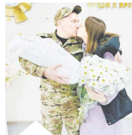
Есть ради кого нашим бойцам идти к победе