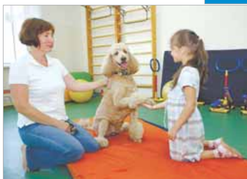
Дай лапу, друг!