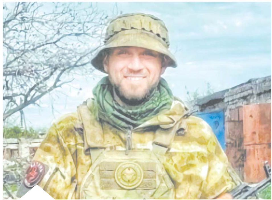
Сейчас «Катунь» восстанавливается после ранения в госпитале и готовится вернуться на фронт

В послужном списке офицера – Авдеевка, которую называли самым укрепленным районом в мире. Может, он и был таким, но только до того момента, как ключик к нему подобрали наши штурмовики, один за другим забирая у противника самые значимые опорники на подступах к этой цитадели ВСУ.