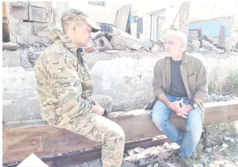
Сегодняшняя война – это когда крохотная «птичка» стоимостью 50 тысяч рублей уничтожает танк стоимостью 10 миллионов

– Необходимо учитывать обстановку не только впереди по курсу, но и справа, и слева, позади и по курсу, смотреть и в небо, откуда могут появиться вражеские беспилотники, и на землю, полную противотанковых и противопехотных мин, неразорвавшихся боеприпасов. Любое осла-