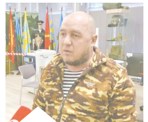
Ростовчанин второй раз едет в зону проведения спецоперации